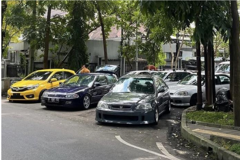
Gambar 1. 3 Kendaraan Dengan Thailand Style