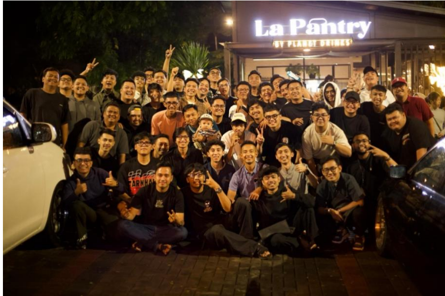
Gambar 1. 2 Komunitas Nasi Uduk Bandung