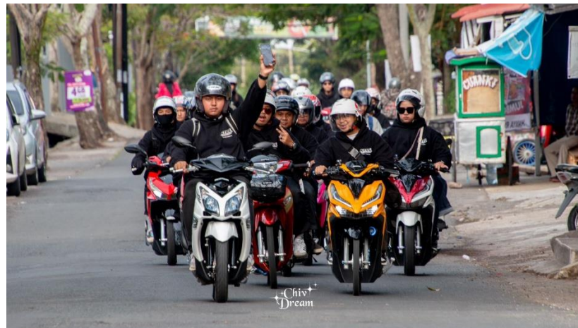
Gambar 1. 1 Komunitas KTRL Bandung