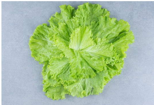
Gambar 2.1 Selada ( Lactuca sativa )

Selada hijau ( Lactuca sativa .) adalah sayuran daun dengan masa pertumbuhan singkat, hanya sekitar 30 hari, yang dapat tumbuh baik di dataran rendah maupun tinggi. Sayuran ini populer berkat berbagai manfaat kesehatannya (Jahro, 2018). Selada kaya akan serat, vitamin, antioksidan, kalium, zat besi, folat, karotenoid, vitamin C, dan vitamin E, yang menjadikannya mendukung kesehatan tubuh secara keseluruhan (Abdullah & Andres, 2021).