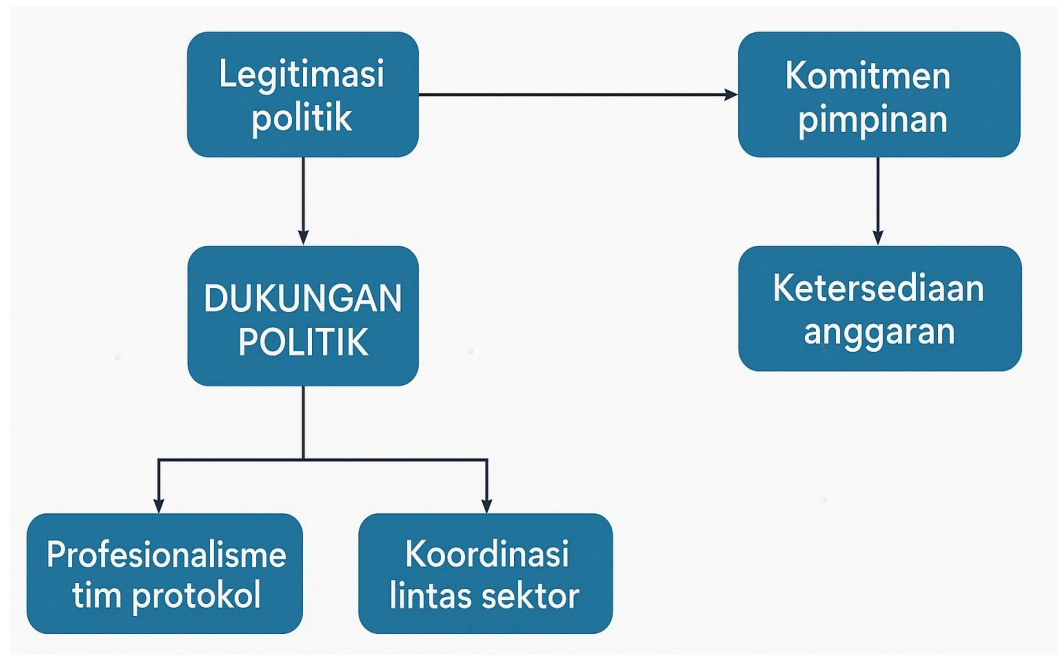
Gambar : Variabel di Luar Kebijakan

Secara keseluruhan, variabel di luar kebijakan berperan besar dalam menentukan kualitas implementasi kebijakan keprotokolan di Jawa Barat. Dukungan politik, integrasi budaya lokal, kolaborasi lintas instansi, budaya kerja internal, dan dukungan masyarakat merupakan faktor yang saling melengkapi dan membentuk ekosistem birokrasi yang adaptif. Apabila seluruh faktor ini berjalan selaras, kebijakan keprotokolan tidak hanya berfungsi secara administratif, tetapi juga mampu memperkuat citra, legitimasi, dan kepercayaan publik terhadap pemerintah daerah.