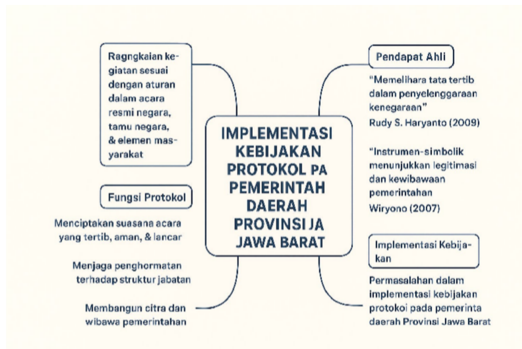
Gambar : Keterkaitan landasan hukum, faktor pendukung dan penghambat, struktur kebijakan, serta fungsi strategis keprotokolandalam menjaga citra dan wibawa pemerintahan.

Secara normatif, dasar hukum keprotokolan diatur dalam Undang-Undang Nomor 9 Tahun 2010 tentang Keprotokolan, yang menegaskan pentingnya tata tempat, tata upacara, dan tata penghormatan sebagai bagian dari wujud penghormatan terhadap jabatan dan kedudukan pejabat negara. Ketentuan tersebut diperkuat dengan Peraturan Menteri Dalam Negeri Nomor 16 Tahun 2024 tentang Pedoman Teknis Keprotokolan, yang memberikan panduan teknis penyelenggaraan keprotokolan di daerah, serta Peraturan Gubernur Jawa Barat Nomor 11 Tahun 2014 tentang Kedudukan Protokol dan Keuangan Pimpinan serta Anggota DPRD Provinsi Jawa Barat.