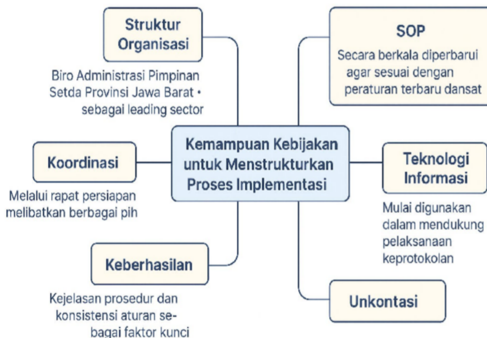
Gambar : Kemampuan Kebijakan Untuk Menstrukturkan Proses Implementasi

Dengan demikian, kemampuan kebijakan keprotokolan Jawa Barat dalam menstrukturkan proses implementasi dapat dikatakan cukup kuat. Kejelasan struktur organisasi, keberadaan regulasi dan SOP yang diperbarui, dukungan teknologi digital, serta peningkatan kapasitas pelaksana menjadi bukti konkret bahwa kebijakan ini dijalankan secara terarah. Namun, dalam dinamika pemerintahan modern yang semakin kompleks, diperlukan penguatan berkelanjutan terhadap integrasi lintas sektor, inovasi digital, serta pembinaan SDM yang profesional agar implementasi kebijakan keprotokolan semakin adaptif dan berdaya guna dalam mendukung citra pemerintah daerah yang berwibawa dan responsif terhadap publik.