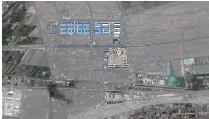
Gambar 1. 2 Kamp Kamp detensi