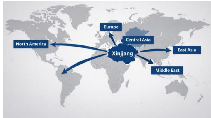
Gambar 1.1 peta penyebaran diaspora Uyghur dari wilayah Xinjiang