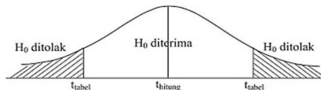
Gambar 3. 2 Uji t Sumber: Sugiyono (2023:248)