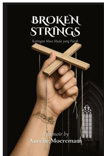
Gambar 1.2 Buku digital Broken Strings

Penyajian isu kekerasan terhadap perempuan dalam buku digital tidak bersifat netral, melainkan dipengaruhi oleh sudut pandang penulis, pilihan narasi, serta cara peristiwa tersebut disampaikan. Buku digital dapat membentuk pemahaman pembaca mengenai suatu peristiwa karena penulis memiliki peran dalam menentukan bagian mana yang ingin ditonjolkan dan bagian mana yang tidak terlalu diperlihatkan.