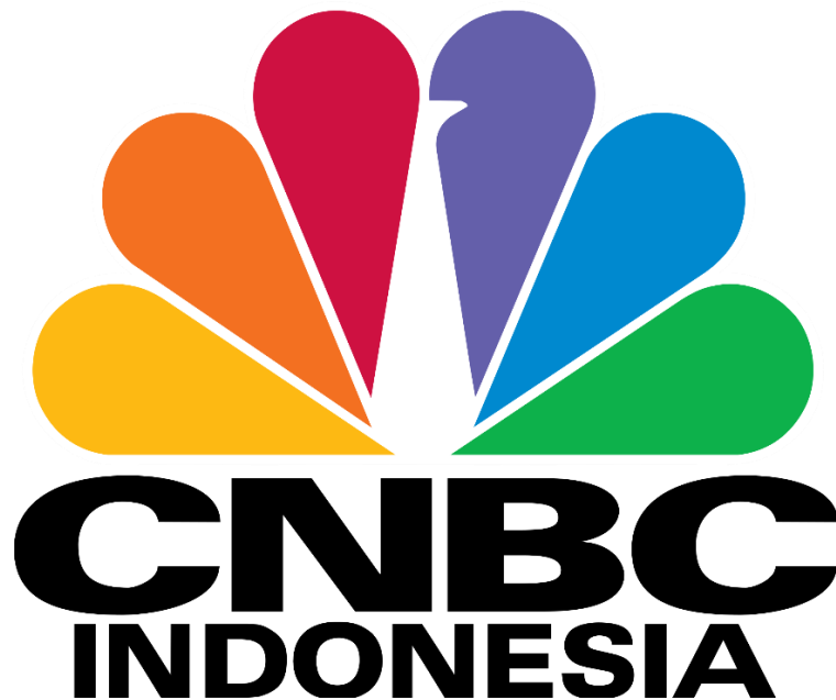
Gambar 2.2 Logo CNBC Indonesia

CNBC Indonesia merupakan media online yang berfokus pada penyajian informasi ekonomi, bisnis, keuangan, dan pasar modal, serta merupakan bagian dari kerja sama antara Trans Media dan CNBC International. Diluncurkan sebagai platform digital yang mengadopsi standar pemberitaan global, CNBC Indonesia menargetkan audiens profesional, pelaku usaha, investor, dan masyarakat umum yang membutuhkan informasi ekonomi yang akurat dan terkini.