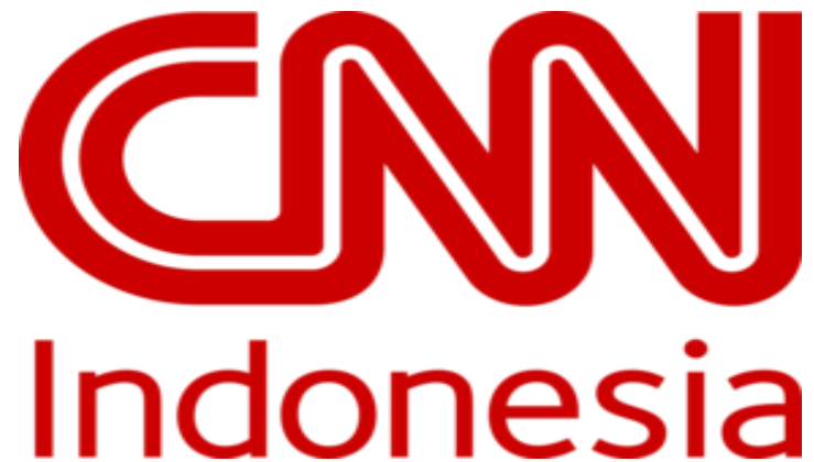
Gambar 2.1 Logo CNN Indonesia