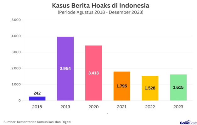
Gambar 1.3 Fluktuasi