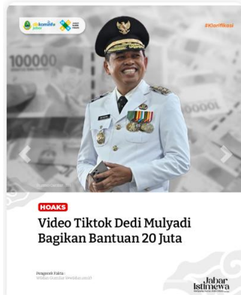
Gambar 1.2 Hoaks mengenai KDM