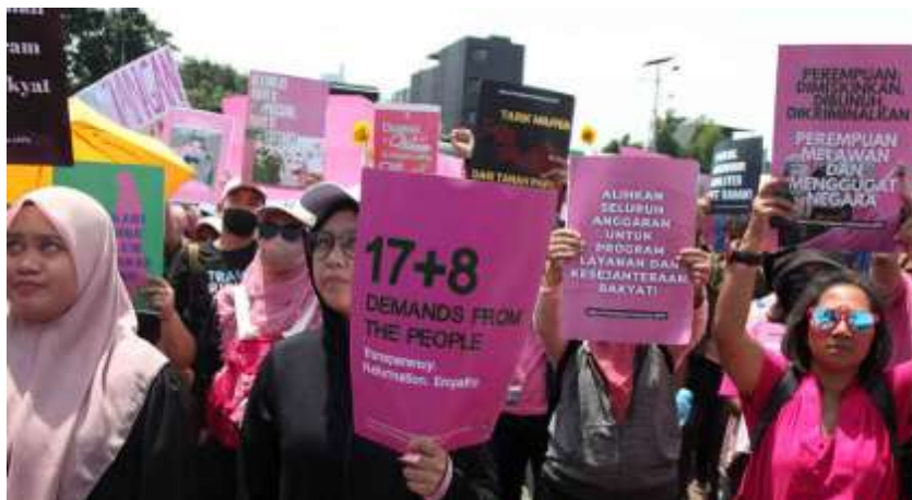
Gambar 2. 4 Fenomena Aksi Massa 2025

Gerakan sosial merupakan bentuk partisipasi kolektif masyarakat untuk memperjuangkan perubahan dalam tatanan sosial, politik, atau budaya. Di era digital, gerakan sosial mengalami transformasi menjadi gerakan digital ( digital activism ), di mana media sosial menjadi arena baru untuk mobilisasi massa dan penyebaran pesan perjuangan. Ruang digital memungkinkan individu dari berbagai latar belakang untuk berkontribusi dalam wacana publik melalui simbol dan representasi visual.