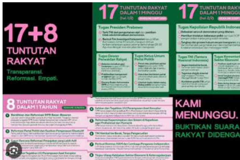
Gambar 2. 5 Bukti Visual Aksi Massa 2025

media sosial, unggahan poster digital, dan tanda grafis menjadi bentuk partisipasi simbolik yang memperkuat jaringan emosional.