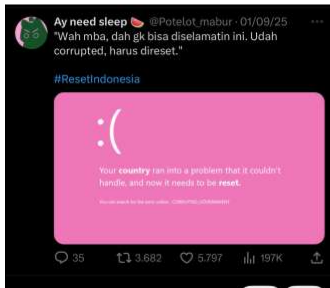
Gambar 2. 3 Fenomena Pink dan Hijau di Ruang X

Platform X (sebelumnya Twitter) memiliki karakter berbeda karena menonjolkan komunikasi berbasis teks singkat yang dipadukan dengan visual seperti foto profil dan header. Dalam fenomena aksi massa 2025, banyak pengguna X (Twitter) yang mengganti foto profil dan header menjadi warna pink atau hijau, menjadikan feed mereka sebagai ruang simbolik perlawanan. Menurut Papacharissi (2015), Twitter merupakan affective public ruang di mana emosi kolektif dimediasi oleh teknologi dan simbol-simbol digital.