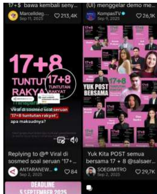
Gambar 2. 2 Fenomena Pink dan Hijau di Ruang TikTok

TikTok berperan penting dalam membentuk “ memetic participation ” partisipasi berbasis tren visual yang memudahkan publik untuk ikut serta dalam gerakan sosial dengan cara yang kreatif dan emosional (Literat, 2021).