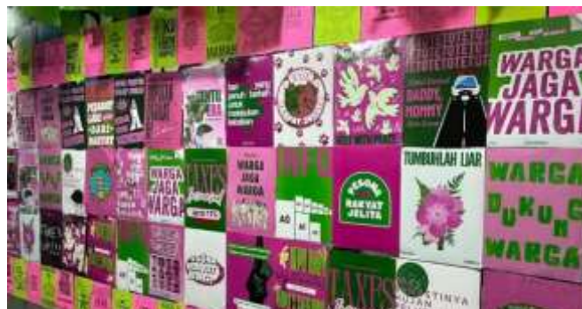
Gambar 1 5 Design Visual Warna Pink dan Hijau dalam Aksi Massa 2025

Kerangka Peirce ini, penelitian berupaya memahami bagaimana warna berperan sebagai bahasa visual yang membentuk komunikasi publik di media sosial. Warna tidak lagi dianggap sebagai ornamen estetika,