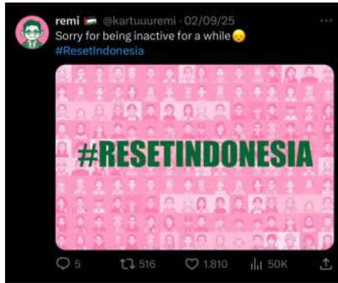
Gambar 1 2 Penggunaan Warna Pink dan Hijau di X

pengguna mengganti foto profil mereka dengan latar berwarna Pink atau Hijau sebagai bentuk dukungan moral terhadap aksi tersebut.