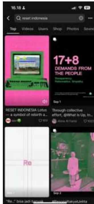
Gambar 1 3 Penggunaan warna pink dan hijau di TikTok

Video-video tersebut sering kali menampilkan kombinasi musik yang melankolis, narasi emosional, dan visualisasi warna yang sinkron dengan pesan solidaritas. TikTok dengan algoritma berbasis For You Page berperan memperluas jangkauan pesan emosional ini, menjadikan warna sebagai kode visual kolektif yang cepat dikenali dan viral (Abidin, 2020).