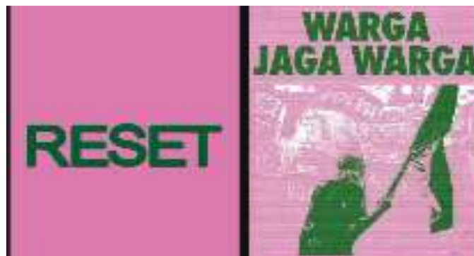
Gambar 1 1 Penggunaan Warna Pink dan Hijau

Tahun 2025, ruang publik Indonesia kembali dipenuhi sastra Indonesia diwarnai oleh gelombang aksi massa bertajuk 17+8 Tuntutan Rakyat