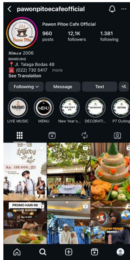
Gambar 1. 2 Akun Resmi Instagram Pawon Pitoe Cafe