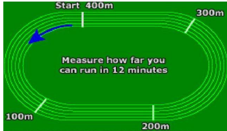
Gambar 2.1 Lintasan Lari Cooper Test 52