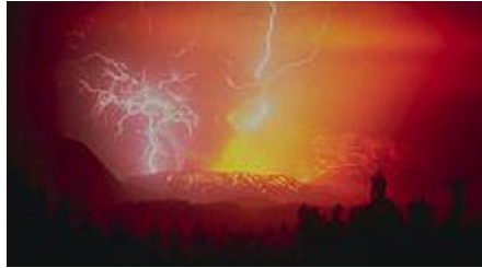
Letusan G. Galunggung tahun 1982