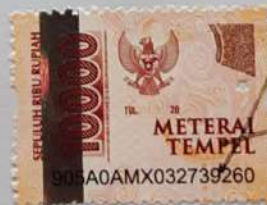
Anggi Mei Saputra