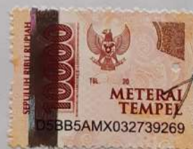
Anggi Mei Saputra