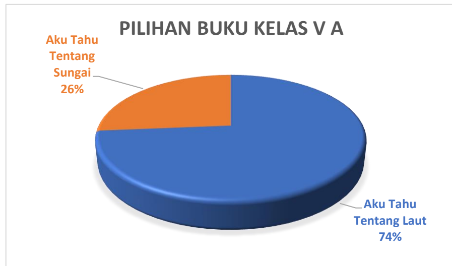
Gambar 3.12 Diagram Pemilihan Buku Kelas V A

Setelah rincian data, dapat disusun dan dianalisis untuk mencari pola dan temuan baru.