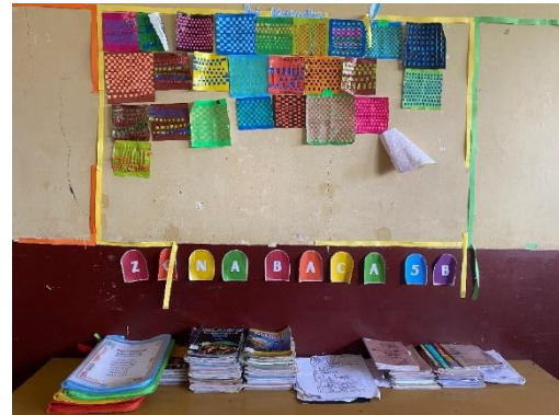
Gambar 3.7 Pojok Baca Kelas V B