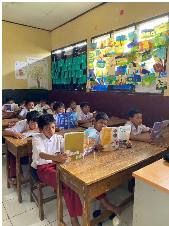
Gambar 3.3 Pembiasaan 15 Menit Membaca Buku di kelas V SDN Kubang

Berdasarkan hasil dari observasi, mendapatkan kesimpulan bahwa siswa kelas V A dan siswa kelas V B berminat untuk membaca buku dengan cara melihat sampul buku terlebih dahulu. Jika pada desain sampul buku terlihat menarik, mereka akan memilih bukunya untuk dibaca. Terlihat saat gurunya memberikan arahan untuk