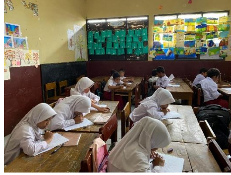
Gambar 3.4 Siswa Kelas V A mengisi lembar Kuisisioner