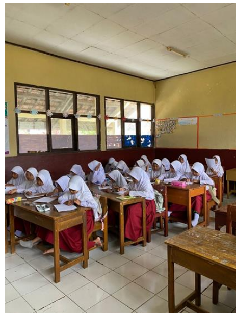
Gambar 3.5 Siswa Kelas V B mengisi lembar kuisisioner