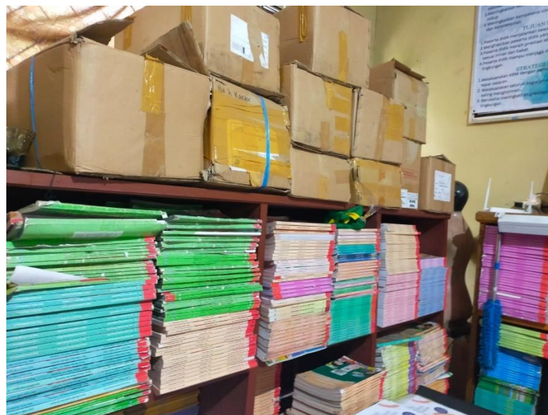
Gambar 3.11 Perpustakaan SDN KUBANG