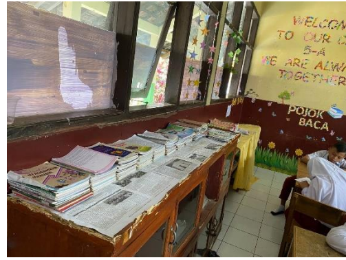
Gambar 3.6 Pojok Baca Kelas V A