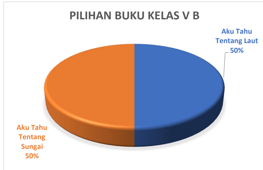
Gambar 3.13 Diagram Pemilihan Buku Kelas V B

Hasil analisis melalui diagram pada gambar 3.13 memperlihatkan bahwa kelas V B yang memilih buku "Aku Tahu Tentang Laut" sekitar 50% atau setara dengan 20 siswa. Sedangkan untuk siswa yang memilih buku "Aku Tahu Tentang Sungai" sekitar 50% atau setara dengan 20 siswa saja. Artinya, setengah siswa dari kelas V B memilih buku "Aku Tahu Tentang Laut" dan setengah siswa lainnya memilih buku "Aku Tahu Tentang Sungai".