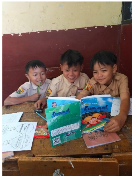
Gambar 3.9 Siswa kelas V B membaca Buku Favorite "Aku Tahu Tentang Sungai"