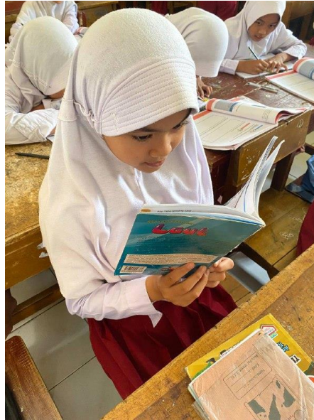
Gambar 3.8 Siswa kelas V A membaca Buku Favorite "Aku Tahu Tentang Laut"