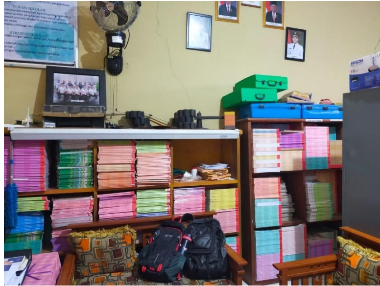
Gambar 3.10 Perpustakaan SDN KUBANG