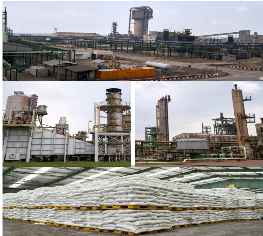
Gambar 3. 3 Area PT. Pupuk Kujang Cikampek