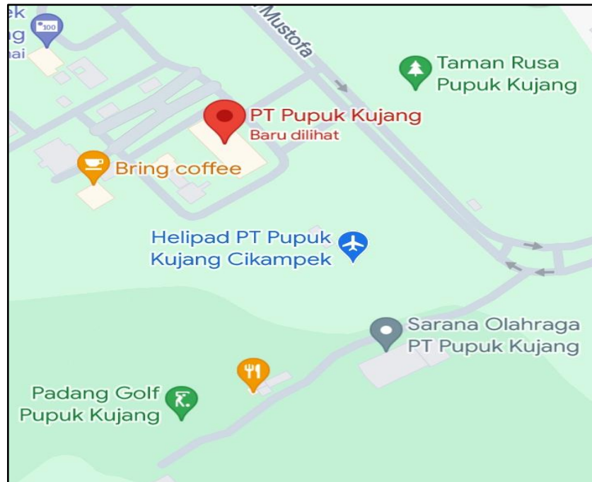
Gambar 3. 2 Lokasi Penelitian