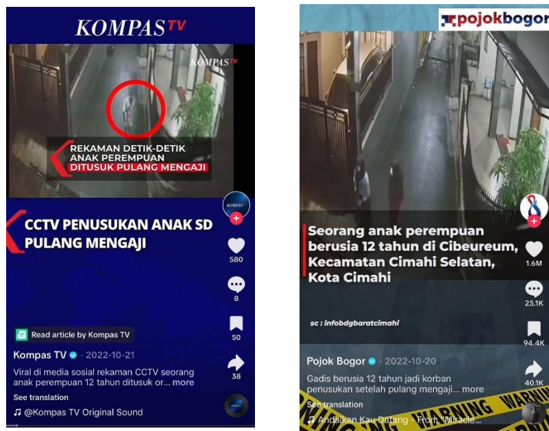
Gambar 1. 2 Postingan Berita

komunikasi, kini fungsi TikTok tidak lagi sekedar mempublikasikan video, berita dan informasi kini menjadi lebih mudah, mulai dari aturan caption aplikasi TikTok yang tadinya hanya 150 karakter, kini menjadi lebih mudah. bisa mencapai 500 karakter. Durasi video yang awalnya dari 15 detik sekarang menjadi 3 menit. Oleh sebab itu media media online pun ikut menyebarkan informasi dan menyebarkan berita menggunakan aplikasi ini. Sebab pemberitaan melalui aplikasi ini dianggap lebih mudah di akses oleh semua kalangan usia dan memberikan peluang yang dapat dijangkau oleh semua orang. Seperti salah satu berita mengenai penusukan anak umur 12 tahun di Cijerah, yang disebarkan oleh beberapa akun media berita seperti Pojok Bogor, Kompas TV, Jabar Expres, Tribun Jabar dan Infobdgbaratcimahi yang ikut menyebarkan berita mengenai penusukan anak 12 tahun di Cijerah se usai pulang mengaji.