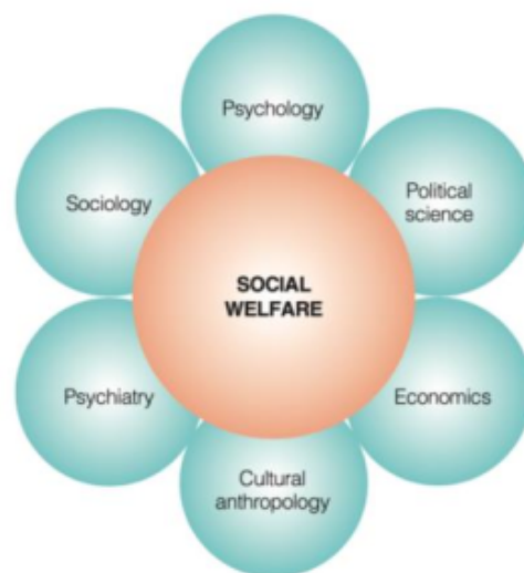
Gambar 2. Overlap antara Pengetahuan Berbasis Ilmu Kesejahteraan Sosial dan Disiplin Ilmu Lainnya

Perlindungan terhadap kerahasiaan file dan catatan berkaitan dengan data organisasi pelayanan kemanusiaan jauh lebih sulit karena teknologi dalam pengumpulan, penyimpanan, dan penerimaan informasi tentang klien berkembang secara eksponensial. Melalui penggunaan teknologi komputer modern, sejumlah besar data dapat dikumpulkan, dicatat, disimpa dan diproses dengan cepat, mudah dan murah.