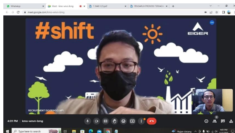
Wawancara Head Office Social Media Marketing Eiger Adventure.