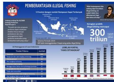
Gambar 2.1 Upaya Pemberantasan Illegal Fishing Oleh KKP Tahun 2014

Oleh karena itu, kini saatnya Indonesia mengambil kendali. Setiap inci lautan harus diatur dengan teliti, sebesar-besarnya demi kemakmuran rakyat. Jaga laut Indonesia, anugrah Tuhan. Gunakan alat tangkap ramah lingkungan, buat peraturan yang mendukung nelayan tradisional dan memperhatikan kelestarian alam. Walau ada pro dan kontra, namun ketegasan untuk mengatakan Stop Illegal Fishing , jaga laut Indonesia, sangat dinantikan. Sekarang atau tidak ada waktu lagi.