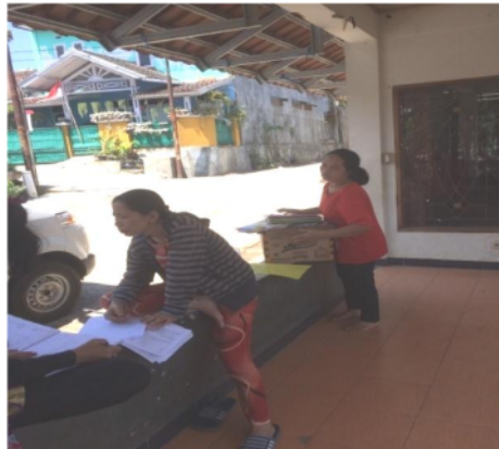
Gambar 2. Aktivitas warga membawa sampah untuk disetor ke bank sampah unit.

Nasabahmenyetorkan sampah yang sudah terpilah seperti terdapat pada Gambar 2, bila sampah masih tercampur, maka relawan akan memilah sampah tersebut. Nasabah yang menyetorkan sampahnya secara langsung akan mendapatkan nota yang berisikan jenis sampah dan beratnya serta harga dari petugas atau pegawai yang ada di tempat penimbangan. Selanjutnya nota tersebut diserahkan kepada petugas/pegawai yang bertugas sebagi perekap data. Nasabah yang ingin menyetorkan sampahnya dengan cara dijemput akan mendapatkan nota yang akan diberikan setelah sampahnya ditimbang .