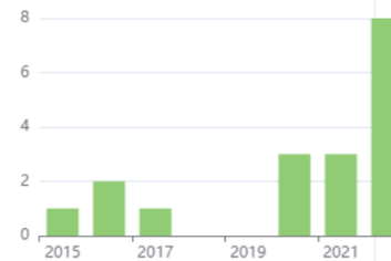
Journal By Google Scholar