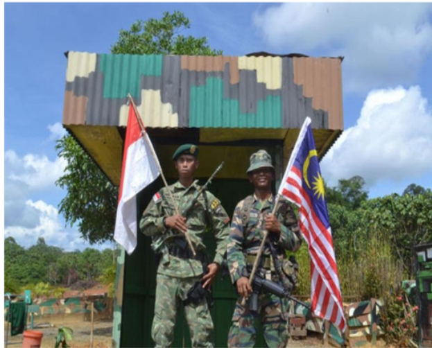
Gambar 1 : Pos Penjaga Perbatasan

Perbatasan Kalimantan dengan Serawak termasuk dalam tipe natural border, perbatasan yang ditandai oleh bentang alam pengunungan Kapuas Hulu. Kawasan ini memiliki potensi besar untuk menjadi pusat pertumbuhan wilayah. Menurut para ekonom perbatasan setidaknya terdapat dua kekuatan besar yang bisa disumbangkan oleh kawasan perbatasan terhadap perekonomian di sekitarnya. Pertama , dengan akses perdagangan yang dimiliki, kawasan perbatasan merupakan pintu masuk barang dan jasa; mengalimya devisa ke dalam negeri. Kedua , perdagangan yang sehat yang terjadi di perbatasan akan mendorong tumbuhnya produksi di dalam negeri.