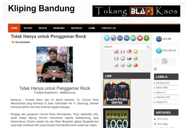
Gambar 3. 1 Artikel Tidak Hanya Untuk Penggemar Rock