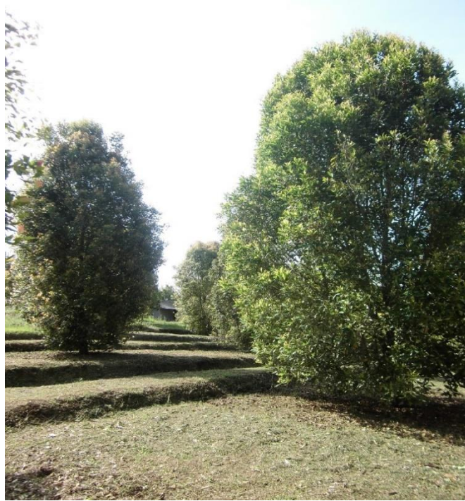
Gambar 2. 1 Tanaman cengkeh ( Syzygium aromaticum )