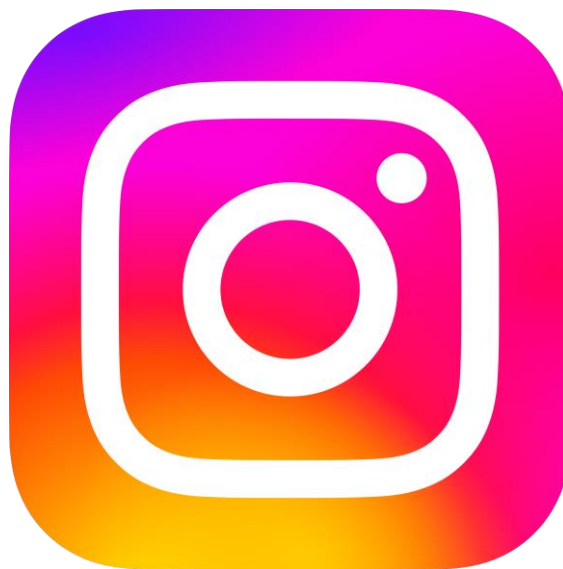
Gambar 2. 2 Logo Instagram