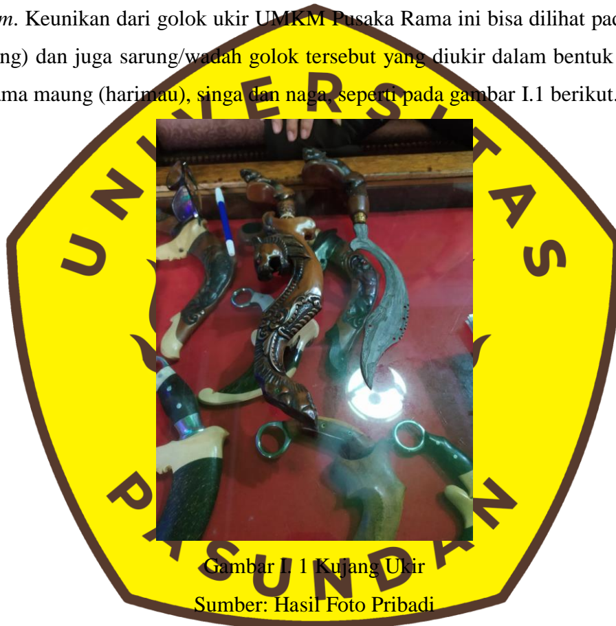
Gambar I.1 Kujang Ukir

Jl. Nangkerok, Mekarlaksana RT 01 RW 13 Desa Panyocokan Kecamatan Ciwidey Kabupaten Bandung Barat. UMKM Pusaka Rama ini merupakan UMKM unggulan dalam sektor pengrajin seni ukir logam dan kayu, UMKM Pusaka Rama ini sudah bisa menjual produk ke luar negeri seperti Malaysia, Amerika Serikat, Singapura, dan lain-lain. UMKM Pusaka Rama ini menggunakan metode make to order untuk produksi golok ukirnya, jika ada yang memesan golok ukir, pengrajin langsung membuat golok ukir sesuai pesanan. Untuk UMKM Pusaka Rama ini menerima berbagai macam jenis dan ukuran golok ukir, mereka juga menerima pesanan custom . Keunikan dari golok ukir UMKM Pusaka Rama ini bisa dilihat pada hulu (gagang) dan juga sarung/wadah golok tersebut yang diukir dalam bentuk hewan terutama maung (harimau), singa dan naga, seperti pada gambar I.1 berikut.