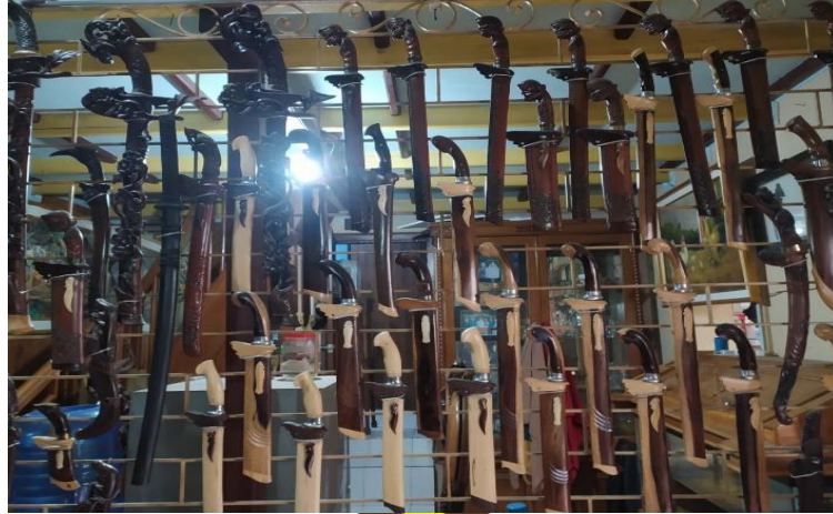
Gambar I.2 Jenis Golok Ukir