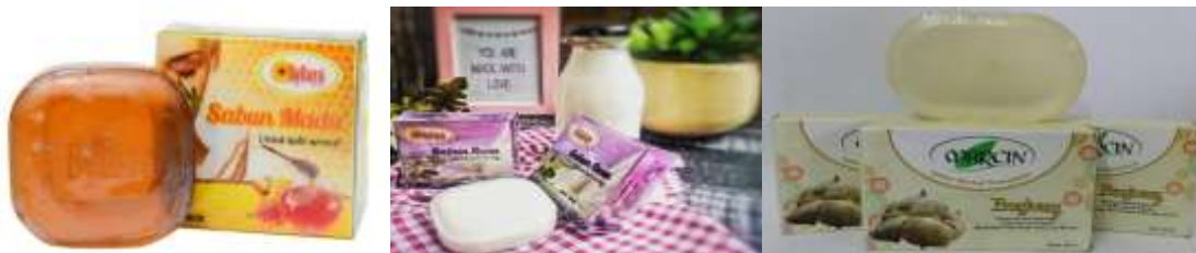
Gambar 1. Sabun Herbal Bydara dan Marcin

Usaha sabun herbal ini sebagai wujud dari keinginan mitra untuk memperkenalkan produk sabun herbal dalam negeri kepada seluruh dunia sebagai salah satu industri Indonesia yang bisa bersaing dengan produk kecantikan modern. Berikut adalah gambar sabun herbal dari kedua Mitra: