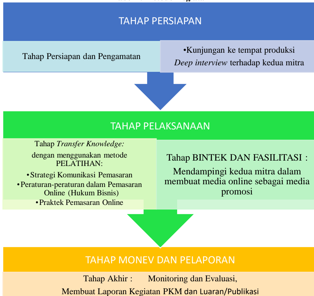
Tabel 2. Metode Kegiatan