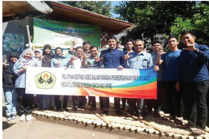
Gambar 6. Semangat literasi para peserta