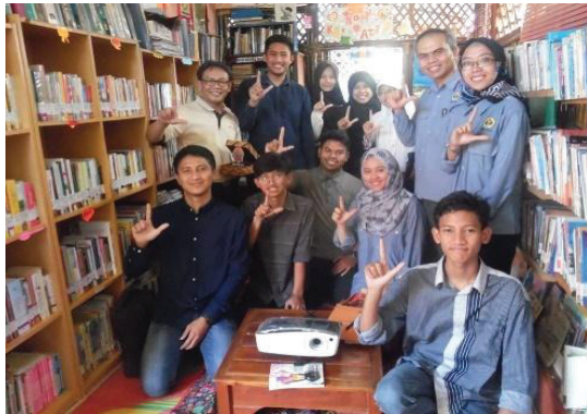
Gambar 2. Berfoto bersama

tinggi dengan memperhatikan, mengajukan berbagai pertanyaan, seperti bagaimana membuat sebuah video yang baik, bagaimana agar pesan di dalam video itu dapat dimengerti oleh khalayak massa, sampai menunjukkan hasil video karya salah satu pegiat literasi informasi tentang TBM yang dikelolanya.