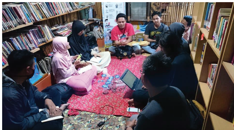
Gambar 1. Berdiskusi di Rumah Baca Kali Atas

Agar roda RBM Kali Atas berjalan dengan baik dan berkelanjutan, pengelolaan untuk sementara langsung di bawah kepengurusan Karang Taruna RW 01 dan siswa SMA terdekat. RBM Kali Atas buka setiap hari dari pukul 13.00 sampai 17.00. Sementara itu, pada hari libur dibuka dari pukul 9.00 sampai pukul 17.00.