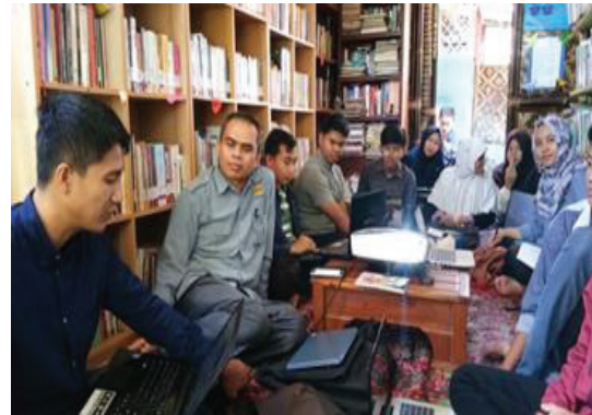
Gambar 3. Suasana pelatihan

Dalam mengedit film dan video, indikator penilaiannya adalah semua peserta mampu menginformasikan maksud dan tujuan konsep awal, yaitu menginformasikan dan menyosialisasikan kegiatan literasi di Cicalengka. Namun, hanya 30% peserta yang mengerti cara mengedit video yang baik dan benar agar pesan itu dapat tersampaikan dengan baik. Peserta tersebut mampu membuat video mengenai literasi membaca yang ditayangkan pada media sosial, seperti Youtube, Facebook, Instagram (Gambar 4 dan Gambar 5), serta kegiatan-kegiatan literasi lainnya di lingkungan Cicalengka.