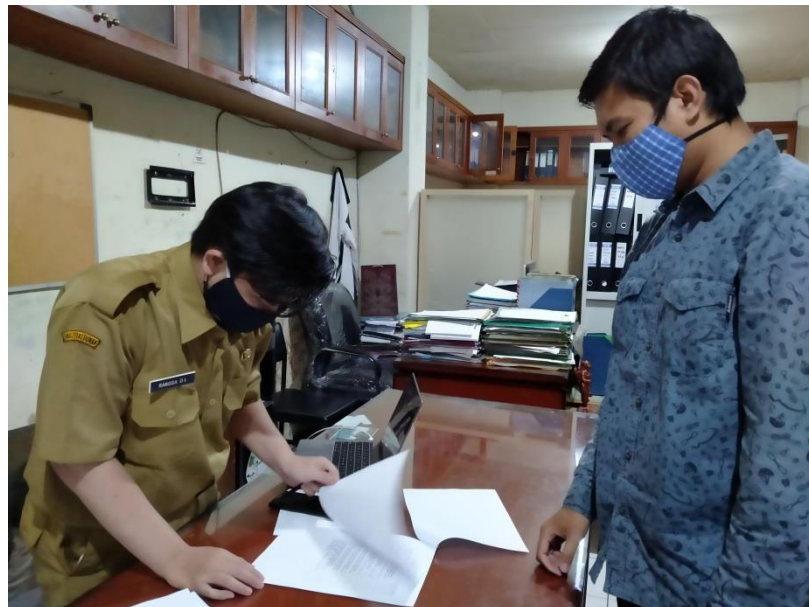
Keterangan : Pelaksanaan nyebar angket kepada para pegawai Dinas Perkebunan Provinsi Jawa Barat