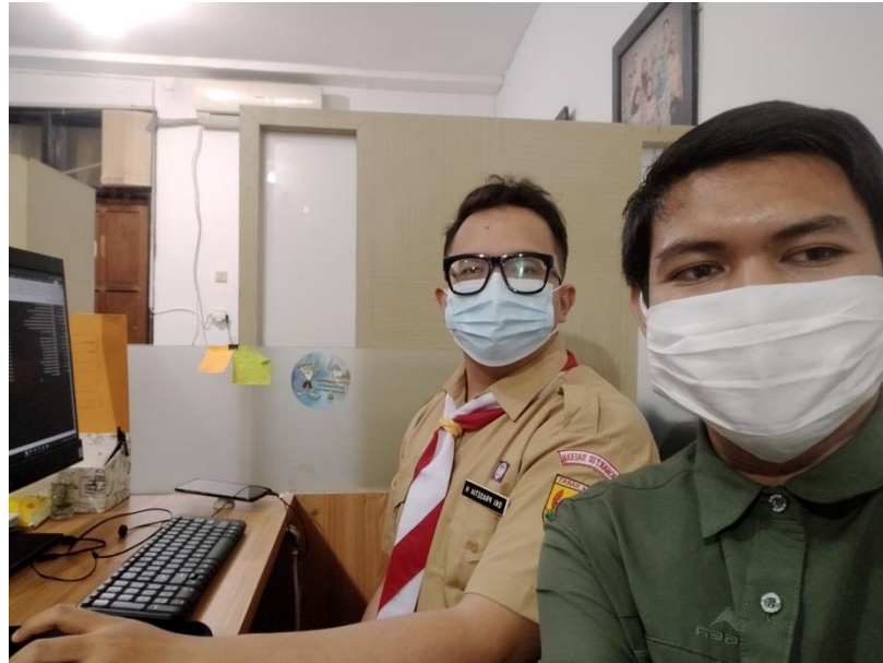
Keterangan : pelaksanaan meminta data Dinas Perkebunan Provinsi Jawa Barat