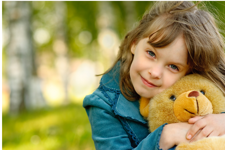
Gambar 2.5.5 Medium Close-up

manusia mendominasi frame dan latar belakang tidak lagi dominan. Adegan percakapan normal biasanya menggunakan jarak medium close-up .