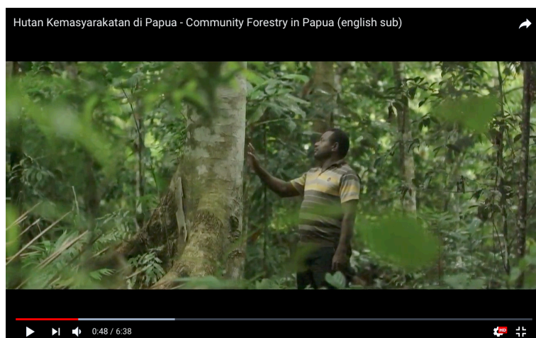
Gambar 2.6.1 Community Forestry in Papua

Film ini menceritakan hutan adalah bagian dari hidup dari masyarakat ada di Papua. Masyarakat adat disekitar hutan telah lama hidup selaras berdampingan dengan alam bukan hanya identitas budaya.