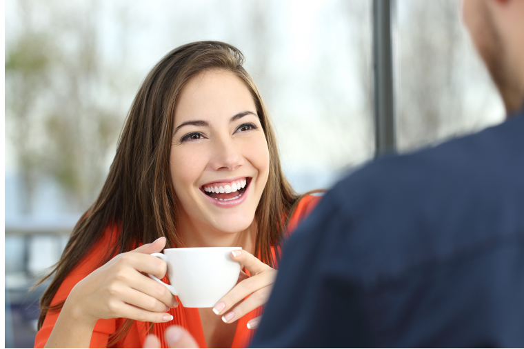
Gambar 2.5.7 Over shoulder shot