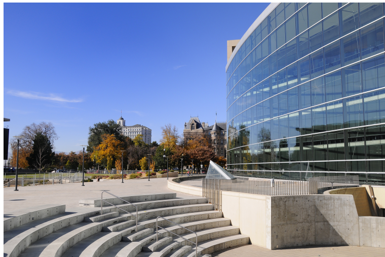
Gambar 2.5.7 Eye level

Eye level shot diambil dengan kamera setinggi mata manusia, menghasilkan efek netral pada penonton.