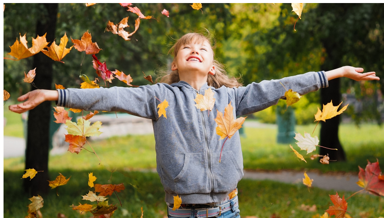
Gambar 2.5.4 Medium shot

Menunjukkan bagian dari subjek lebih detail. Untuk seseorang, medium shot memperlihatkan tubuh manusia dari pinggang ke atas. Ini adalah salah satu bidikan yang paling umum terlihat dalam film, karena berfokus pada karakter dalam adegan sambil tetap menunjukkan lingkungan tertentu.