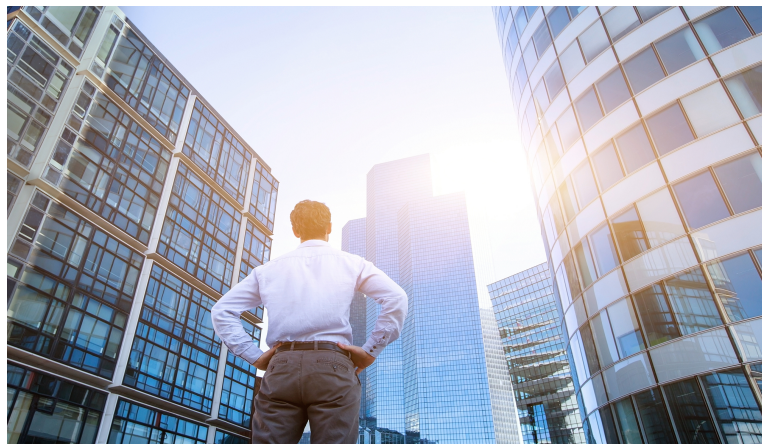
Gambar 2.5.10 Low-angle

Low-angle menunjukkan sudut objek dari bawah mata. Ini dapat memiliki efek subjek terlihat kuat, heroik, atau berbahaya.