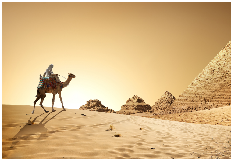
Gambar 2.5.2 Long shot

Menunjukkan subjek dari atas ke bawah untuk seseorang, ini akan mengarah ke jari kaki, meskipun tidak harus mengisi bingkai. Karakternya menjadi lebih fokus daripada extreme long shot , tetapi bidikannya cenderung masih didominasi oleh pemandangan. Bidikan ini sering mengatur adegan dan tempat karakter di dalamnya. Long shot sering kali digunakan sebagai establishing shot , yakni shot pembuka sebelum digunakan shot-shot yang berjarak lebih dekat.