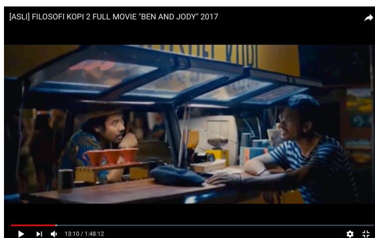
Gambar 2.6.2 Filosofi Kopi

Film yang menceritakan tentang pencaharian jida dan perjalanan berdamai dengan masa lalu melalui kopi. Sebuah kedai kopi terkemuka di Jakarta yang hanya menyediakan kopi terbaik Indonesia. Sebuah film yang tidak hanya bercerita, tapi juga membuka wawasan baru untuk melihat kopi Indonesia dalam bingkai yang penuh gairah dan cinta.