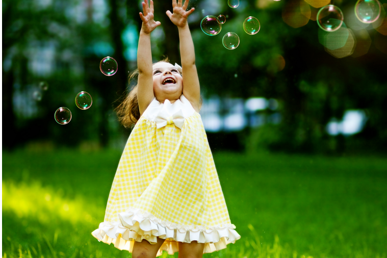
Gambar 2.5.3 Medium long shot