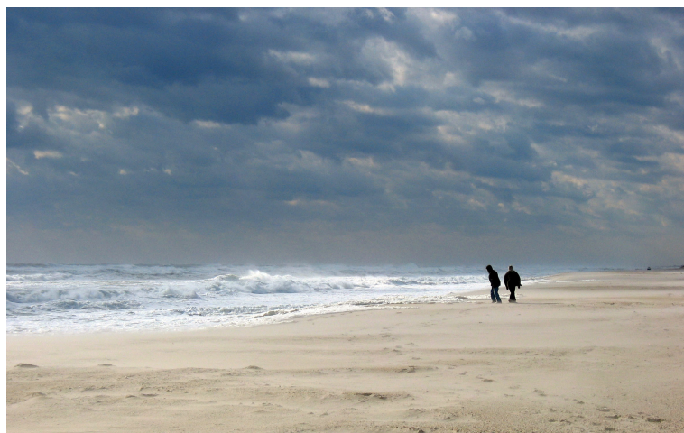
Gambar 2.5.1 Extreme long shot

Menunjukkan subjek dari jarak jauh, atau area dimana adegan itu berlangsung. Jenis shot ini sangat berguna untuk membangun adegan dalam hal waktu dan tempat, serta hubungan fisik atau emosional karakter dengan lingkungan dan elemen di dalamnya. Karakter tidak harus terlihat dalam bidikan ini.