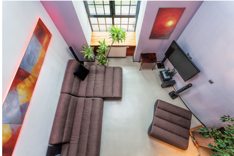
Gambar 2.5.8 Top angle (eagle eye)

elemen audiens di luar batas-batas kesadaran karakter. Shot ini sering di ambil menggunakan drone atau helikopter.