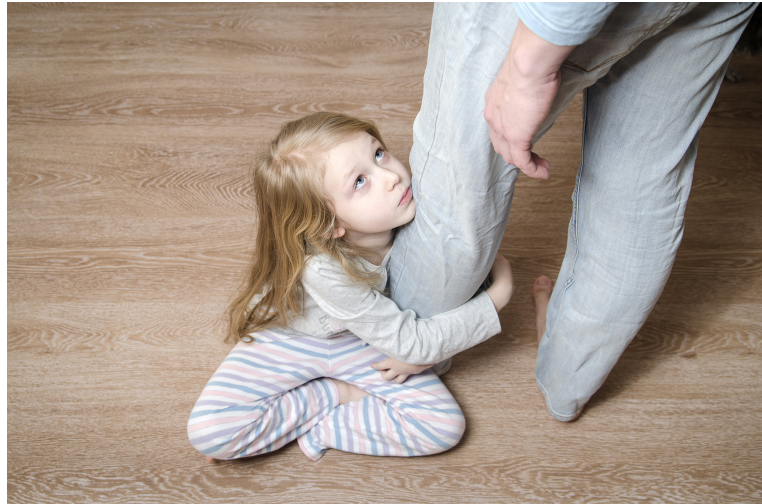
Gambar 2.5.9 High-angle

Sudut kamera high-angle diambil dari ketinggian mata di atas. Ini dapat memiliki efek subjek tampak rentan, lemah, atau ketakutan.