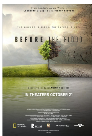
Gambar 2.6.3 Poster Before The Flood

Diproduksi selama tiga tahun perjalanan mengagumkan, yang dilakukan Leonardo Di Caprio bersama tim kreatif National Geographic dan sutradara Fisher Steven. Film dokumenter ini menceritakan tentang perubahan musim yang terjadi pada bumi.