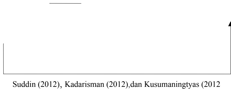
Gambar 2.1 Paradigma penelitian