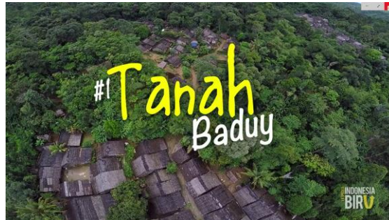
Gambar 2.5 Poster Tanah Baduy

e. Tanah Baduy – Ekspedisi Indonesia Biru di wilayah Baduy dengan menceritakan masyarakat Baduy melalui dubbing dan diisi oleh stock shot untuk mengisi visualsnya.