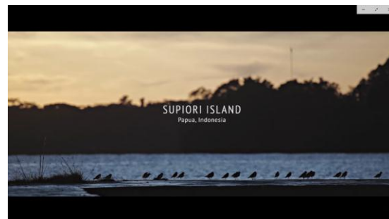
Gambar 2.4 Film wwf indonesia Supiori Island

d. Supiori Island film dokumenter yang menceritakan masyarakat Supiori di Papua merawat alam dalam keadaan apapun, yang mereka lakukan mampu membuat masyarakat Supiori selamat dari berbagai bencana alam.