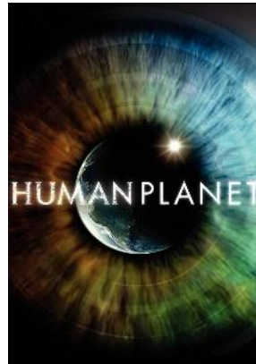
Gambar 2.1 Poster HUMAN PLANET

Peneliti memilih film ini karna ada hubungan luar biasa antrara umat manusia dengan alam di dunia saat ini. Setiap episode membawa penonton ke gunung, lautan, hutan, padang rumput, gurun, sungai, dll. Di sini penonton akan melihat orang-orang yang bertahan hidup dengan membangun hubungan yang kompleks, dan seringkali saling menguntungkan dengan berbagai tantangan.