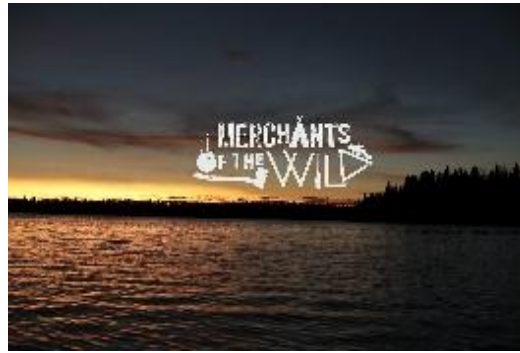
Gambar 2.2 Poster MERCHANTS OF THE WILD

Dalam film ini peneliti ingin memperlihatkan bagaimana masyarakat Baduy bertahan hidup dari era globalisasi, dan tetap mempertahankan apa yang telah leluhur mereka lakukan untuk tetap menjaga lingkungan kehidupannya hingga saat ini sebagai ilmu pengetahuan untuk masyarakat.