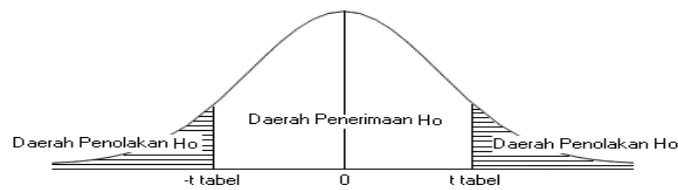
Gambar 3.2 Daerah Penerimaan dan Penolakan Hipotesis

Adapun rancangan hipotesis dalam penelitian ini adalah sebagai berikut: