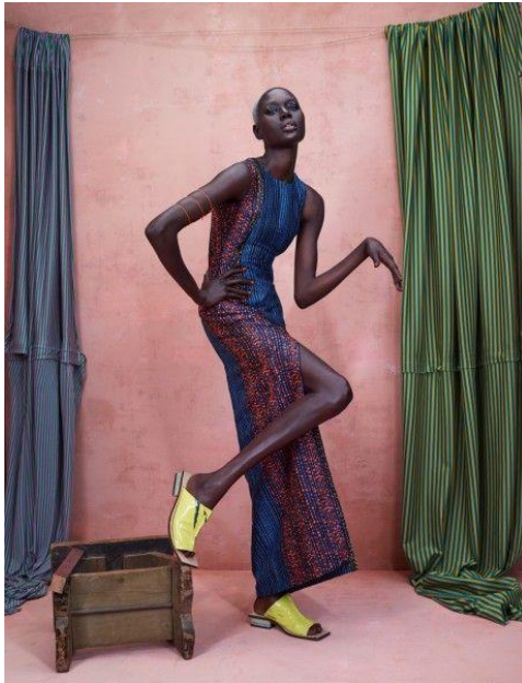
Gambar 3.2 Background