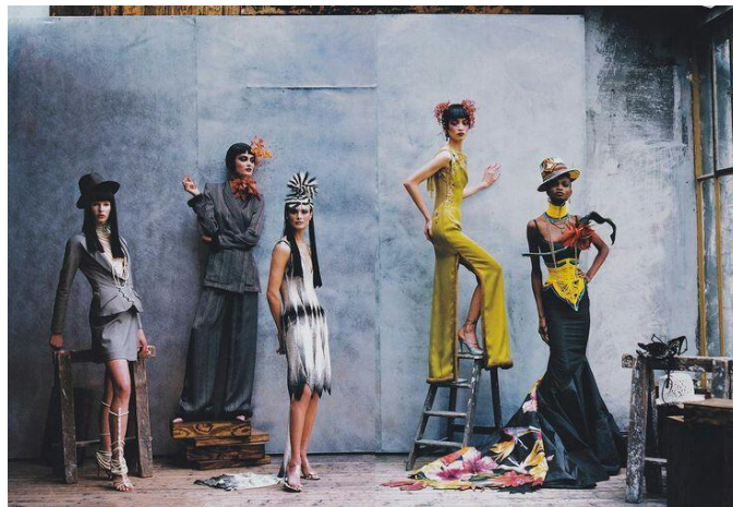
Gambar 3.3 Penempatan Pose

Dalam gambar di atas, peneliti mengambil contoh lighting dan background .