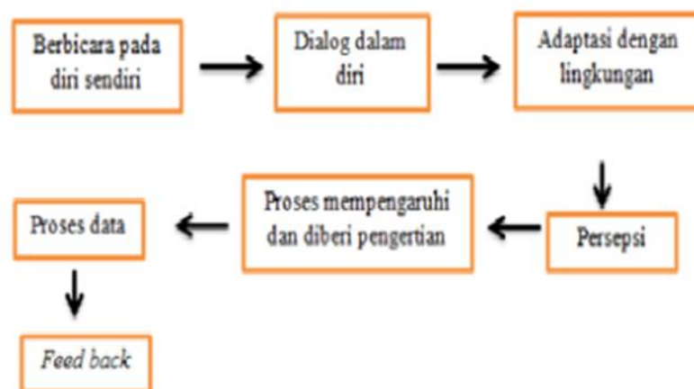
Gambar 2.1 Komunikasi Intrapersonal

Dalam buku Trans-Per Understanding Human Communication , 1975, disebutkan bahwa komunikasi intrapersonal adalah proses di mana individu menciptakan pengertian. Di lain pihak Ronald L. Applbaum dalam buku Fundamental Concept in Human Communication mendefinisikan komunikasi intrapersonal sebagai: Komunikasi yang berlangsung dalam diri kira, ia meliputi kegiatan berbicara kepada diri sendiri dan kegiatan-kegiatan mengamati dan memberikan makna (intelektual dan emosional) kepada lingkungan kita (Uchayana 1993)