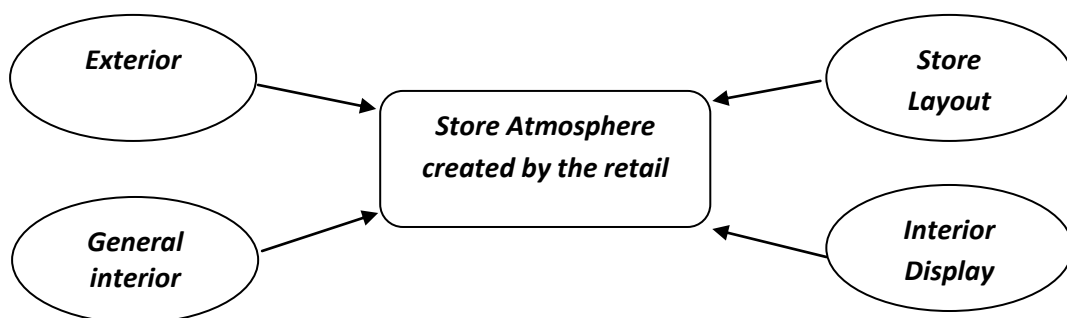
Gambar 2.1 Elemen-Elemen Store Atmosphere

Menurut Berman dan Evan yang dialih bahasakan Lina Salim (2014:545), Store Atmosphere memiliki elemen-elemen yang semuanya berpengaruh terhadap suasana cafe yang ingin diciptakan. Elemen-elemen tersebut terdiri dari Exterior , Interior , Store Layout , Interior Display .