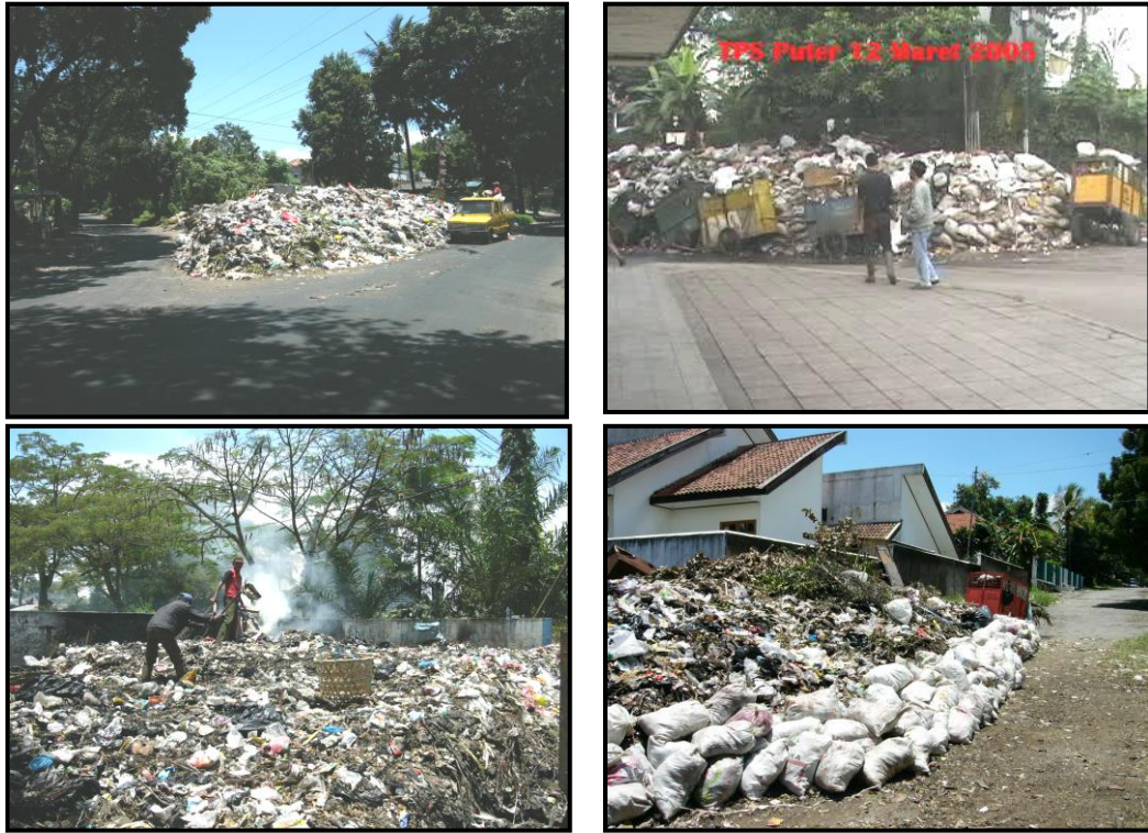
Gambar 4.3 Kondisi Beberapa Titik di Kota Bandung Pasca Longsor TPA Leuwigajah

Rendahnya tingkat partisipasi masyarakat untuk mengelola sampah dapat diakibatkan oleh berbagai hal, diantaranya :