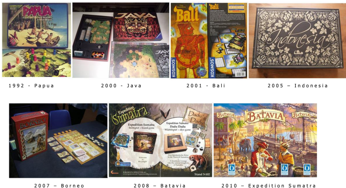
Gambar Error! Use the Home tab to apply 0 to the text that you want to appear here..1 board game luar negeri yang bertemakan Indonesia

Perkembangan board game sangat signifikan dalam semua aspek dan komponen. Mulai dari cerita permainan yang beragam, tema permainan, mekanik yang bervariasi hingga estetika menjadi unsur pembeda tiap board game .